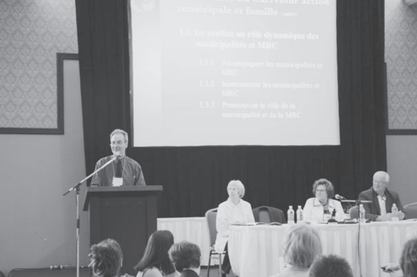
Présentation du rapport d'activités 05-06 lors de l'assemblée générale