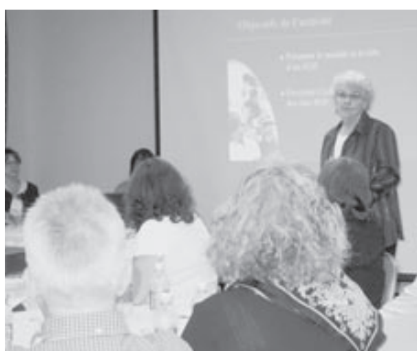
Le samedi, les représentants municipaux prenaient part à différents ateliers sur neuf thèmes différents