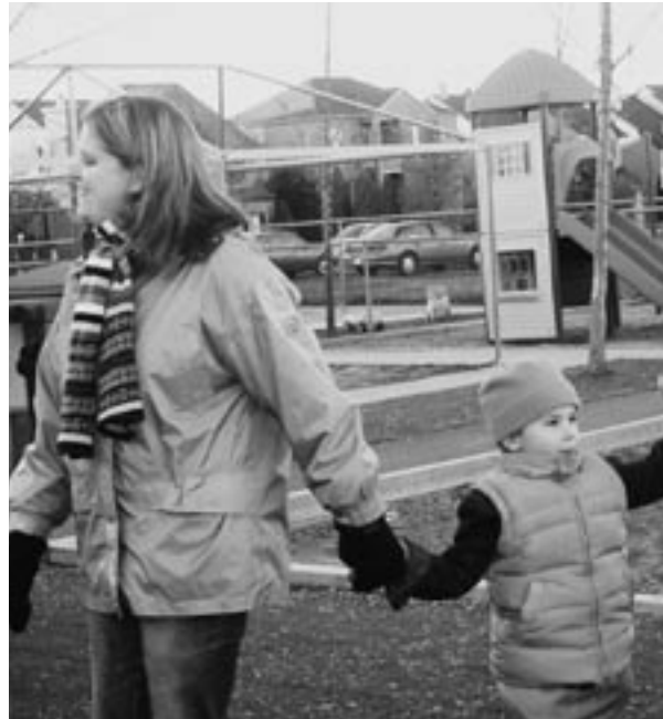
CPE Les Petits Semeurs, Sr-Hubert