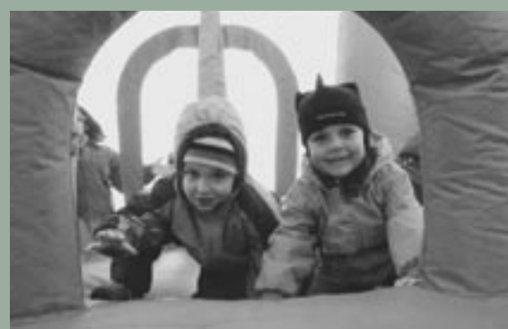
CPE Les Petits Semeurs, St-Hubert