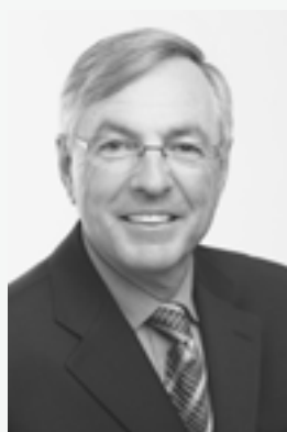
Jean Perrault maire de Sherbrooke

Le problème de l'alimentation inadéquate et de la sédentarité ne touche pas seulement les jeunes, mais également leurs familles et l'ensemble des individus. Si les jeunes s'alimentent moins bien et sont peu actifs, leurs parents sont bien souvent dans la même situation. En effet, 56 % des adultes ne consomment pas le minimum de 5 portions de fruits et légumes recommandées